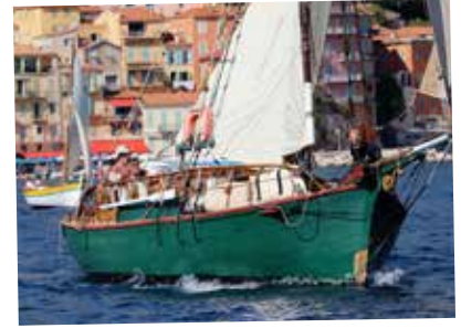
Moby Dick en parade

Organisée par l'ABPV les 5 et 6 octobre, cette manifestation unique sur la Côte d'Azur a été une fois de plus une totale réussite avec près de 40 bateaux de tradition réunis au port de la Darse. Régates à la voile, à la rame, parade, soirée musicale, remise des prix, paëlla géante pour 180 convives et en plus, la réalisation d'un tournage avec France 3 Côte d'Azur... Tous les ingrédients réunis pour passer un bon week-end entre passionnés français et italiens de belles traditions méditerranéennes. Bravo à toute l'équipe de l'ABPV pour cette grande fête de la mer !