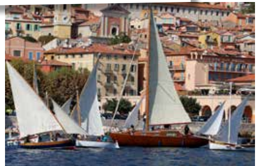
Les régates devant le port de la Santé