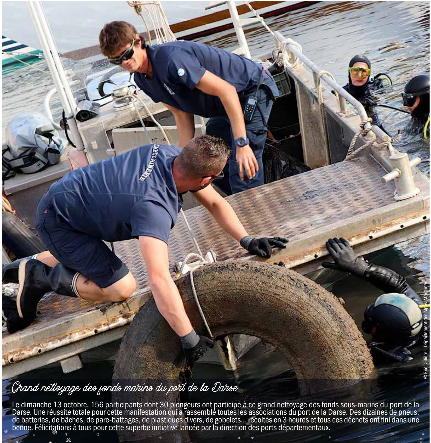
Grand nettoyage des fonds marins du port de la Darse

✦ Lettre d'information n°4 ✦ ✦ Décembre 2019 ✦