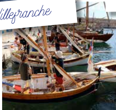
On peaufine les réglages