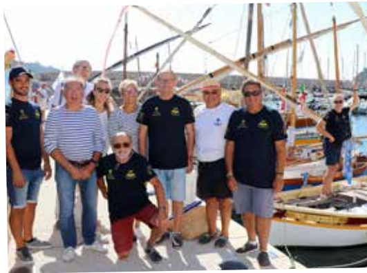
Les passionnés de l'ABPV