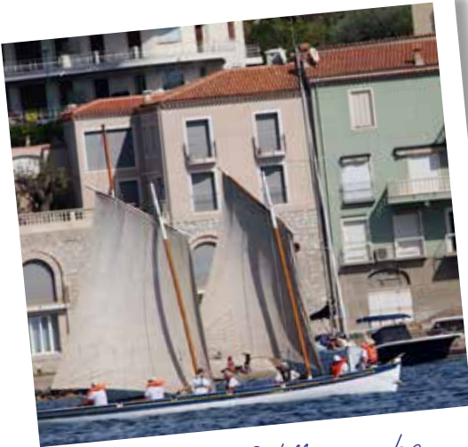
La Yole de Villefranche